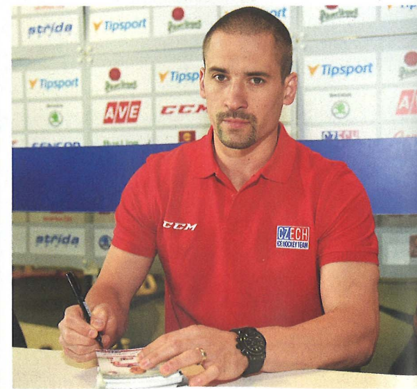
Autogramiáda pro fanoušky