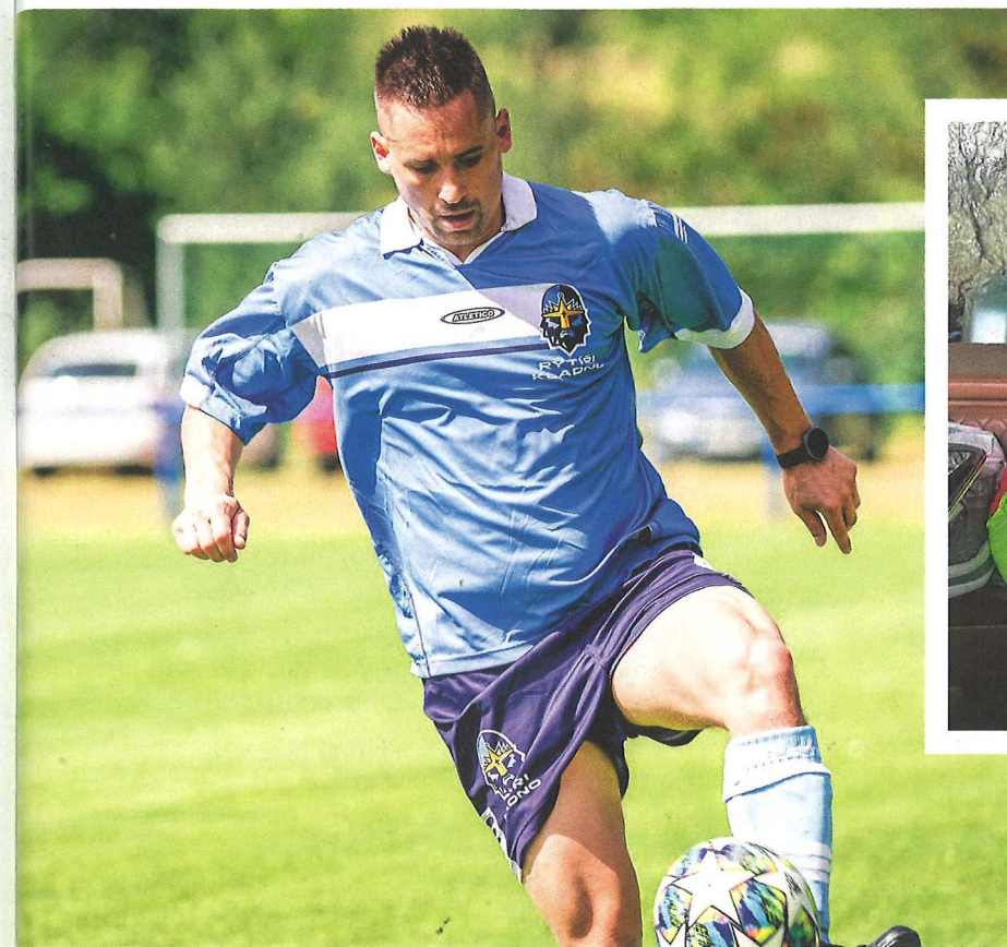
Charitativní fotbalový zápas Hokejky na pažitu

Nepochybně, asi na tisíc procent. Životospráva má na výkon obrovský vliv. Možná to není na první pohled znatelné, ovšem správné stravování a návyky, co a kdy si dát před zápasem, před tréninkem nebo po něm, jsou strašně důležité.